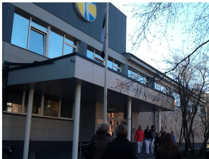
Figur 2 Tallinna Kõrgkool