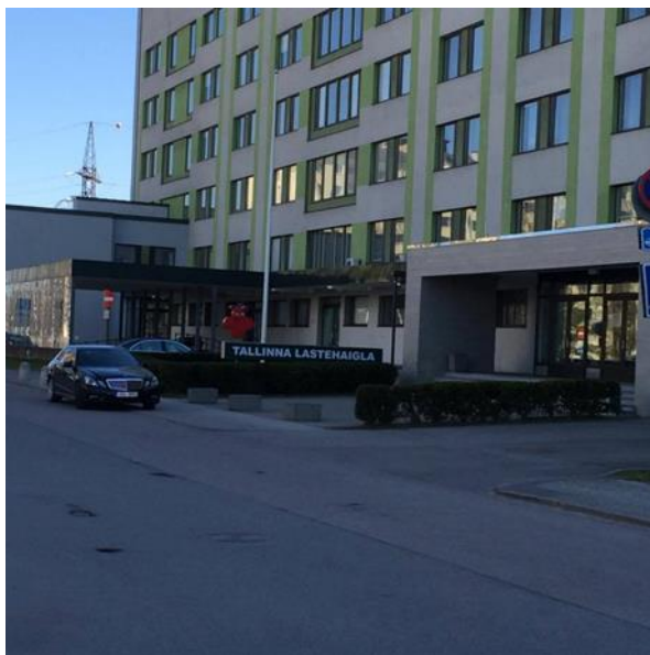
Figur 3 Børnehospital

Det er muligt at få økonomisk tilskud fra Social- og Sundhedsskolen Fyn/ Erasmus+, så længe der er en bevilling. Du får også din løn fra Danmark under praktikopholdet